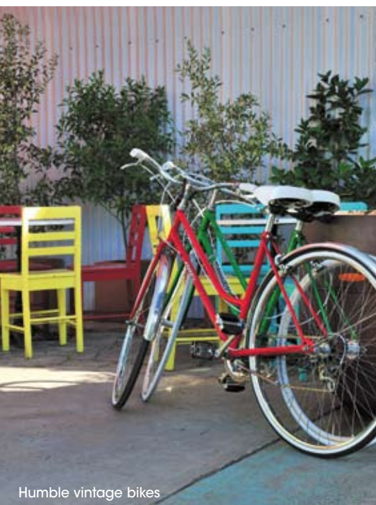
Humble vintage bikes