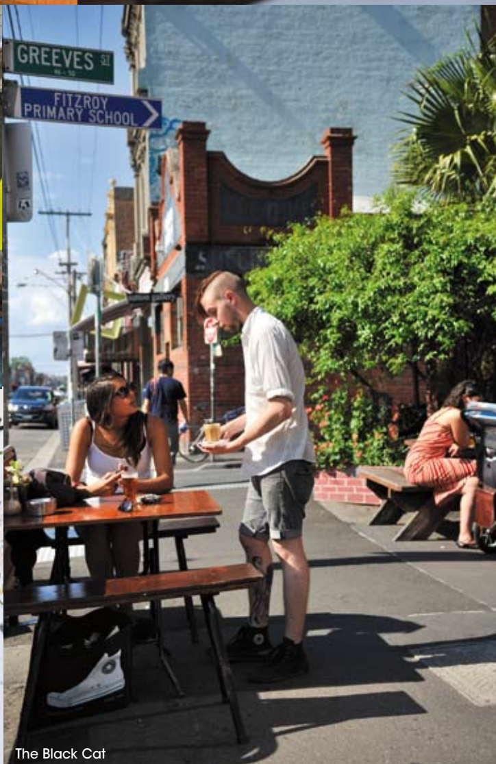
The Black Cat