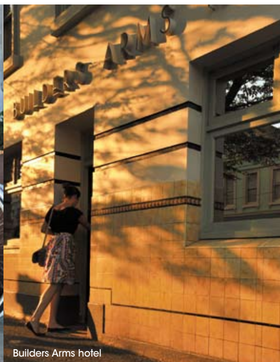
Builders Arms hotel