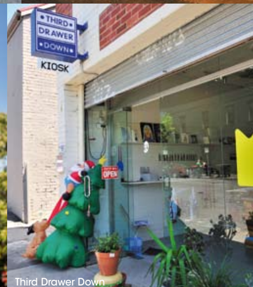
Third Drawer Down